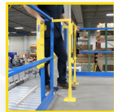
Sistema de montaje con inclinación