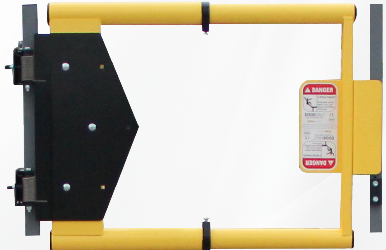
Número del producto: ASG-1836-PCY