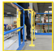
Sistema de montaje con inclinación